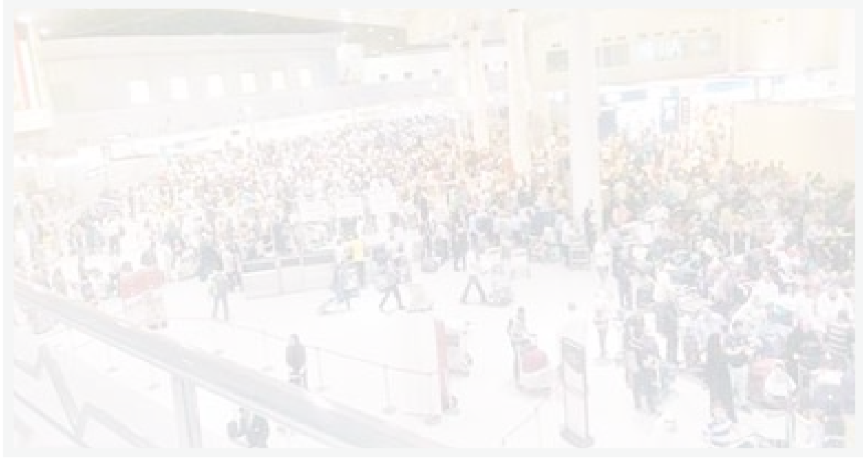
هل سيشهد موسم الصيف ازدياداً كبيراً رغم ارتفاع أسعار التذاكر؟