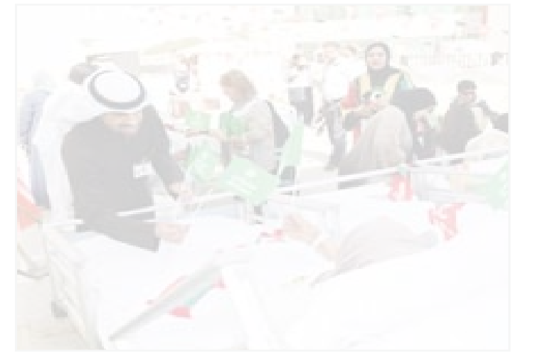
أثناء توزيع الهدايا على النزلاء