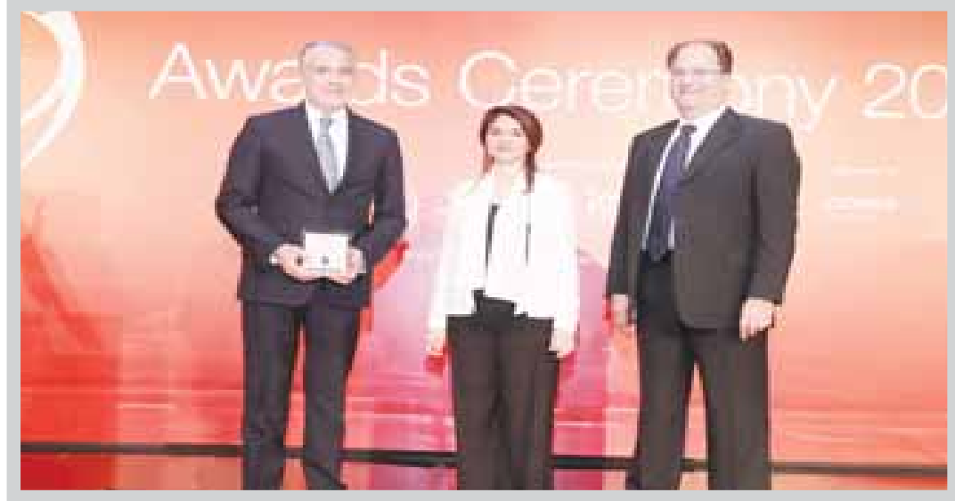
زين تتلقى جائزتها في حفل سيرفس هيرو

منحت مؤسسة "سيرفس هيرو" المؤشر الوحيد في الكويت لقياس مستوى رضا العملاء والمستهلكين على الخدمات المقدمة لهم على مستوى دولة الكويت - شركة زين المركز الأول على مستوى قطاع الاتصالات المتعددة للمرة الخامسة، وذلك عن فئتي "أفضل مشغل اتصالات، و"أفضل مزود خدمات إنترنت" في الكويت عن العام 2016.