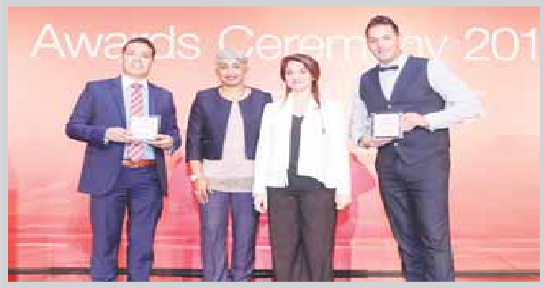
محلات الشاي حصدت 7 جوائز

حصلت عدة علامات تجارية عالمية تديرها شركة محمد حمود الشاي على سبع جوائز تميز في خدمة العملاء، وذلك تقديراً لتمييزها وجودة أدائها ورفقي مستوى خدمة العملاء فيها بحسب تقرير مؤشر "سيرفس هيرو" لعام 2016. وقد فاز مطعم "ذي تشيزيك فاكوتوري، بالمركز الأول من حيث مستوى جودة الخدمة فيه عن فئة المطاعم العصرية في الكويت والإمارات العربية المتحدة.