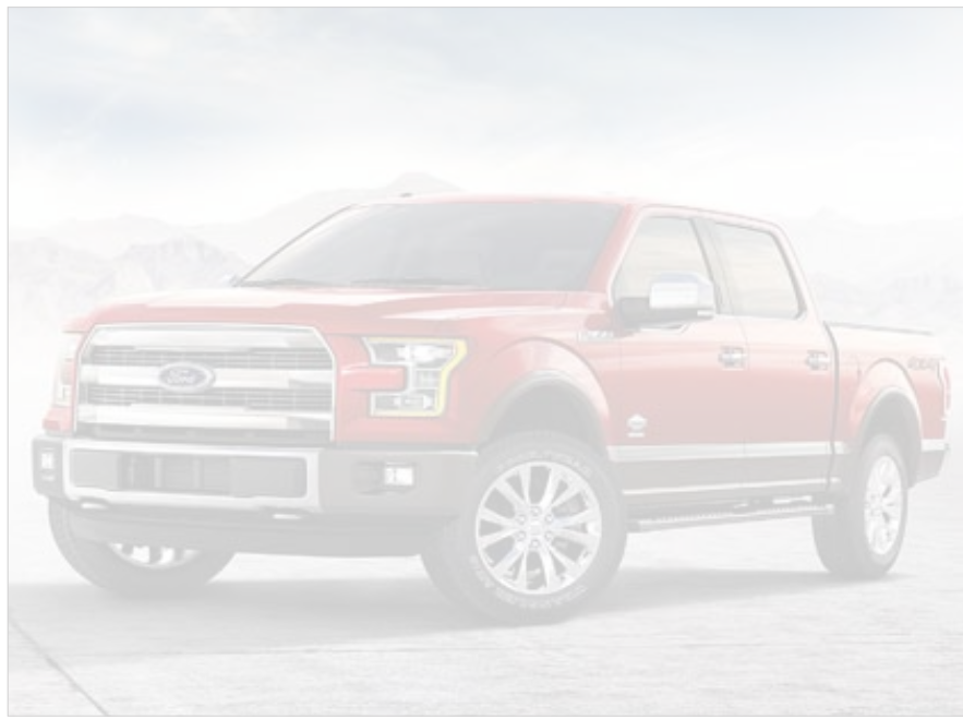
● شاحنة فورد F-150

وأظهر بحث أجرته شركة فورد بأن مزايا الموثوقية والقدرة الفائقة والمخانة في F-150 تشكل أبرز ما يميز هذه الشاحنة ويمنحها التفوق على منافسيها. وأكد المتسوقون في هذا السياق بأنهم يولون الجودة في شاحنات البيك أب أهمية خاصة مقارنة بالمزايا الأخرى. ويمكن للعملاء المهتمين بمعرفة المزيد عن مجموعة شاحنات فورد F-150 موديل 2017 أن يزوروا معرض الغانم أوتو للسيارات الجديدة في منطقة الشويخ الصناعية مقابل متحف السيارات الكلاسيكية وحلبة سرب.