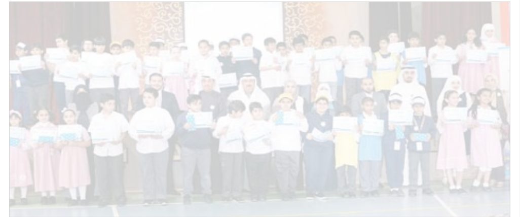
● جانب من فعاليات الحملة

في إطار جهوده المتواصلة لنشر التوعية الصحية بين جميع شرائح المجتمع، شارك بنك الكويت الدولي مؤخراً في الحملة التوعوية الخامسة «صحة فمي.. صح»، وذلك في سياق رعايته لفعاليات برنامج الأحمدية المدرسي لصحة الفم والأسنان الذي ينظمه برنامج الأحمدية المدرسي لصحة الفم والأسنان.