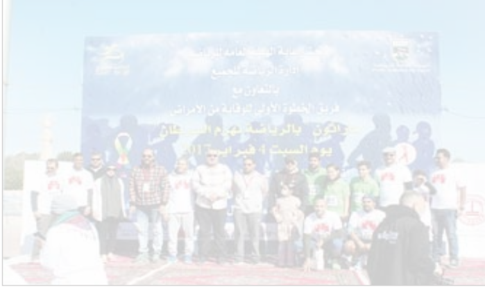
● جانب من الفعالية

شاركت شركة بحرة التجارية، إحدى شركات مجموعة السابر القابضة، إلى جانب إحدى ماركاتها الأساسية (سوبر كات) وإدارة التميز المؤسسي في المجموعة في ماراثون يوم السرطان العالمي، تحت عنوان «بالرياضة نهزم السرطان».