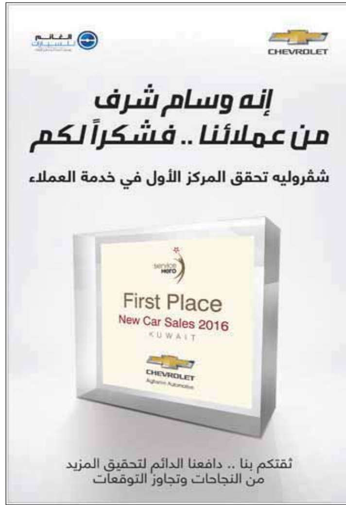
● الجائزة وقد استحققتها «شفروليه الغانم» بجدة

وبهذا الفوز الجديد، شكرت الشركة عملاءها وجمهورها على الثقة الكبيرة التي تعزز بها، وتعمل دوماً على الارتقاء بها وفق أعلى المستويات الدولية، ليكون رضا العملاء هو الهدف الجوهري والغاية المنشودة لجميع الأنشطة التي تقوم بها الشركة في جميع معارضها ومراكزها. ويعكس هذا الفوز الجديد فلسفة «شفروليه الغانم» في تركيزها الجوهري على خدمة وتجربة العملاء في كل ما تقدمه للسوق المحلية من منتجات وخدمات قبل وبعد عملية البيع، ما يجعل الشركة تتبوأ هذه المكانة البارزة. وهذا الالتزام الاستراتيجي هو تعبير واضح عن الثقة الكبيرة التي تتمتع بها الشركة في الكويت نتيجة لعراقتها وتاريخها الحافل في عالم السيارات في الكويت، وما تقدمه من تطوير دائم في خدماتها