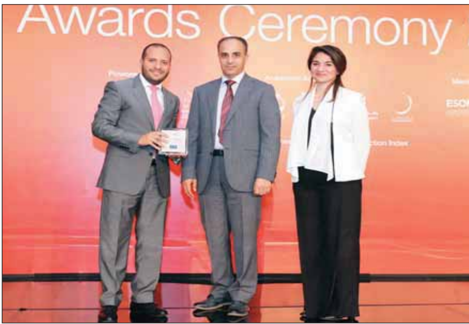
• ممثل X- سايت يتسلم الجائزة في دبي

لعملائها وزوار معارضها، التي تنتشر في مختلف مناطق الكويت، إضافة لموقعها الإلكتروني الذي يقدم عروضاً حصرياً للتسوق الإلكتروني الأوفر والأسرع على مدار السنة.