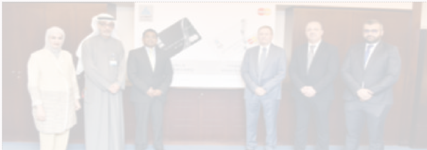
صورة جماعية ضمت قيادات «الدولي» و«ماستر كارد»

أعلن بنك الكويت الدولي إطلاقه بطاقتي ائتمان جديدتين من ماستر كارد، هما بطاقة وورلد ماستر كارد وتيتانيوم ماستر كارد المتوفران الآن لجميع عملاء البنك. وتأتي هذه الإضافات الجديدة لعائلة بطاقات بنك الكويت الدولي في إطار شراكته الاستراتيجية طويلة المدى مع شركة ماستر كارد العالمية، وذلك بهدف إثناء الحلول المصرفية التي يقدمها البنك وتوفير تجربة مصرفية متطورة ومصممة خصيصاً لتلبية احتياجات العملاء المتنوعة. يذكر أن البطاقات الجديدة تمنح عملاء الدولي مجموعة من المزايا الحصرية والإمميزات الخاصة المصممة لتناسب أسلوب حياتهم العصرية، والتي تشمل خصاصة استرجاع 3% من قيمة المشتريات والمتوفرة حالياً لجميع حاملي بطاقات الدولي. كما تتمتع بطاقة تيتانيوم ماستر كارد بالعديد من المزايا، مثل دخول قاعات المطارات الخاصة، وخصومات التسوق عبر الإنترنت، وخصومات خدمة حجز سيارات الأجرة من «كريم»، وعروض «اشتر واحد واحصل على الثاني مجاناً» الحصرية، وغيرها الكثير. وبإمكان حاملي بطاقة وورلد ماستر كارد من الدولي الاستمتاع بمزايا حصرية أثناء سفرهم حول العالم، مثل دخول غير محدود إلى قاعات المطارات، وعروض الفنادق والشقق الفاخرة، وخصومات على تذاكر الطيران، وتأمين شامل على السفر، والعديد من المزايا والعروض الحصرية الأخرى. جاليجان: نقدم أكثر المزايا تطوراً لحاملي بطاقات البنك ضمن استراتيجيتنا طويلة المدى والتي تركز على توفير منتجات فريدة شراكة «الدولي» مع «ماستر كارد» ستساعد في تعزيز باقة حلوله المصرفية لتطوير منتجات البنك وخدماته ومنح عملائه أفضل تجربة مصرفية «الدولي» حريص على متابعة احتياجات وأولويات العملاء و منحهم مزيجا من المنتجات والخدمات التي تناسبهم