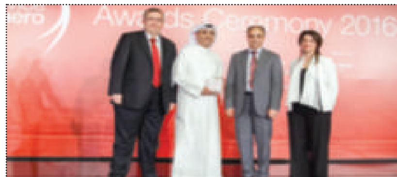
التوجيهي متسلماً للجائزة

تتعلق بخدمة العملاء تزداد يوماً بعد يوم وتضع على عاتق مختلف إدارات البنك مسؤوليات جديدة.