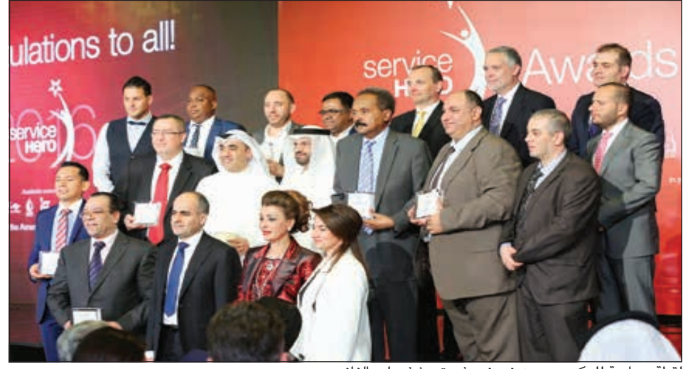
لقطة جماعية للمكرمين ومن ضمنهم فريق «شفروليه الغانم»

حققت شفروليه الغانم المركز الأول في خدمة العملاء من سيرفيس هيرو للعام 2016 عن فئة مبيعات السيارات، بحيث فازت بذلك على 50 علامة تجارية أخرى تم تقييمها. وجاءت هذه النتائج بناء على تصويت مباشر مع الجمهور مما يعطي تلك النتائج مصداقية بارزة في السوق المحلية.