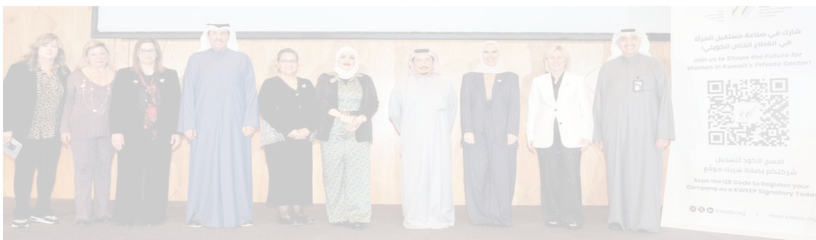
جانب من مؤتمر «منصة الكويت للتمكين الاقتصادي للمرأة»