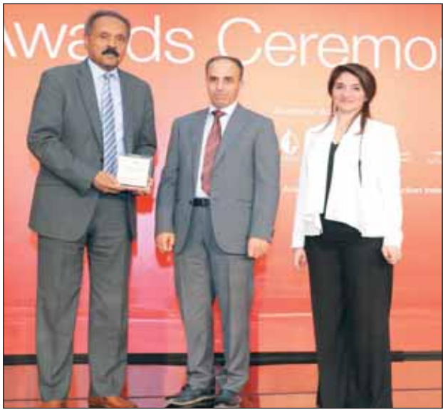
● ممثل عن مستشفى رويال حياة يتسلم الجائزة

يحتفل مستشفى رويال حياة هذه السنة أيضاً بإنجاز يعكس مقدار الثقة والتقدير، الذي تحظى به من عملائه، إذ حصل للمرة السابعة على جائزة سيرفيس هيرو، التي يتم التصويت عليها من قبل العملاء في الكويت، لتقييم الخدمات في الشركات والمؤسسات في كل القطاعات.