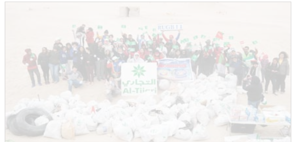
● جانب من الحملة

أما في النوع بان «التجاري» يسعى إلى دعم مثل هذه الحملات، التي تهدف إلى نشر الوعي البيئي، وتعزيز المسؤولية الاجتماعية بين أفراد المجتمع. وأشارت الورع إلى أن هذه الرعاية قد جاءت في إطار حرص البنك التجاري على نشر ثقافة المحافظة على البيئة وإبراز البعد البيئي، ليكون إحدى الأولويات الوطنية في منظومة العمل التنموي التطوعي. وكشفت أن هذه الحملة شارك فيها عدد من موظفي البنك، بالإضافة إلى عدد من الطلاب والطالبات، حيث قاموا بغرس النباتات التي تتناسب مع البيئة الصحراوية، وهو ما يساهم في المحافظة على البيئة البرية.