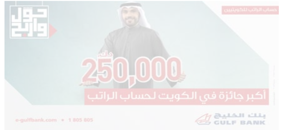
● ملصق حساب الراتب الجديد

ويمكن للعملاء الذين يحولون رواتبهم إلى بنك الخليج الحصول على بطاقات فيزا وماستركارد الائتمانية من بنك الخليج من دون الحاجة إلى دفع الرسوم السنوية خلال العام الأول، أو فرصة الحصول على قرض يصل إلى 70000 دينار كويتي، يتم تسديده خلال مدة 15 عاماً، أو قرض استهلاكي تصل قيمته إلى 15000 دينار كويتي.