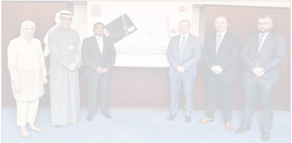
● جانب من حفل إطلاق البطاقتين

أعلن بنك الكويت الدولي عن إطلاقه بطاقتي اتحسان جديديتين من ماستركارد، هما بطاقة وورلد ماستركارد وتيتانيوم ماستركارد المتوفران الآن لجميع عملاء البنك. وتأتي هذه الإضافات الجديدة لعائلة بطاقات بنك الكويت الدولي في إطار شراكته الاستراتيجية طويلة المدى مع شركة ماستركارد العالمية، وذلك بهدف إثراء الحلول المصرفية التي يقدمها البنك وتوفير تجربة مصرفية متطورة ومصممة خصيصاً لتلبية احتياجات العملاء المتنوعة. يذكر أن البطاقات الجديدة لعائلة عملاء الدولي مجموعة من المزايا الحصرية والإمكانيات الخاصة المصممة لتناسب أسلوب حياتهم المعاصرة، والتي تشمل خصية استرجاع 3% من قيمة المشتريات والمخوفرة حالياً لجميع حاملي بطاقات الدولي. كما تتمتع بطاقة تيتانيوم ماستركارد بالعديد من المزايا، مثل دخول قاعات المطارات الخاصة، وخصومات التسوق عبر الإنترنت، وخصومات خدمة حجز سيارات الأجرة من «كريم»، وعروض