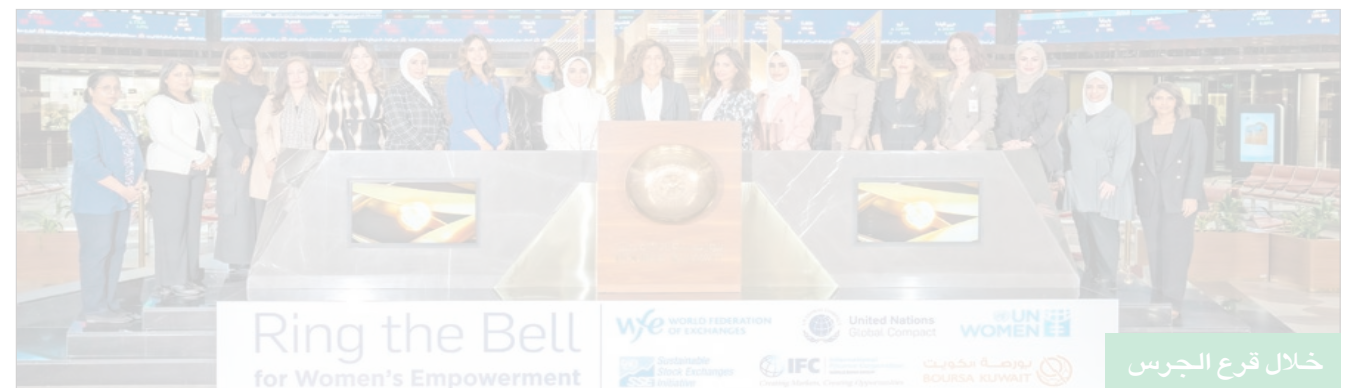
خلال قرع الجرس

انضمت بورصة الكويت إلى أكثر من 100 بورصة عالمية بمبادرة قرع الجرس لتمكين المرأة للسنة السابعة على التوالي، وذلك يأتي احتفاءً باليوم العالمي للمرأة. وتؤكد هذه المبادرة، التي تنظمها الهيئة العامة للأمم المتحدة للمرأة بالاشتراك مع الاتحاد العالمي للبورصات حول العالم، الدور الحاسم الذي يمكن أن تقوم به البورصات في تحقيق أهداف الأمم المتحدة للتنمية المستدامة.