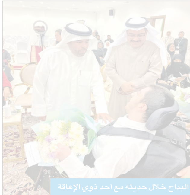
البداح خلال حديثه مع أحد ذوي الإعاقة

البداح: حريصون على دمج ذوي الإعاقة الذهنية في المجتمع