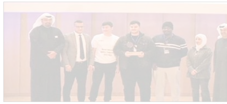
الفريق الفائز بالجائزة

فاز فريق كلية الكويت للعلوم والتكنولوجيا KCST بجائزة وطن الابتكار وهي الجائزة الرئيسية في مسابقة الكويت الوطنية للروبوتات التي نظمت من قبل جامعة الكويت ومركز صباح الأحمد للموهبة والإبداع وشركة زين في إطار جهودها المستمرة لتعزيز الإبداع والابتكار في مجال تصميم وصناعة الروبوتات تحت مظلة وطن الابتكار. وتعتمد هذه الجائزة على مجموعة من المعايير المحددة بعناية، وتمنح للفريق الذي يتمتع بقدرات عالية على الابتكار والتميز في صناعة الروبوت والتصميم. ونجح فريق KCST في تحقيق الفوز بجائزة وطن الابتكار بفضل العمل الجماعي والمهارات الاستثنائية، واستطاع الفريق، من خلال الإبداعات الفنية، صناعة الروبوت وتصميمها، ما أبرز قدرات طلاب كلية الكويت للعلوم والتكنولوجيا بين المشاركين والذي نال إعجاب اللجنة التحكيمية.