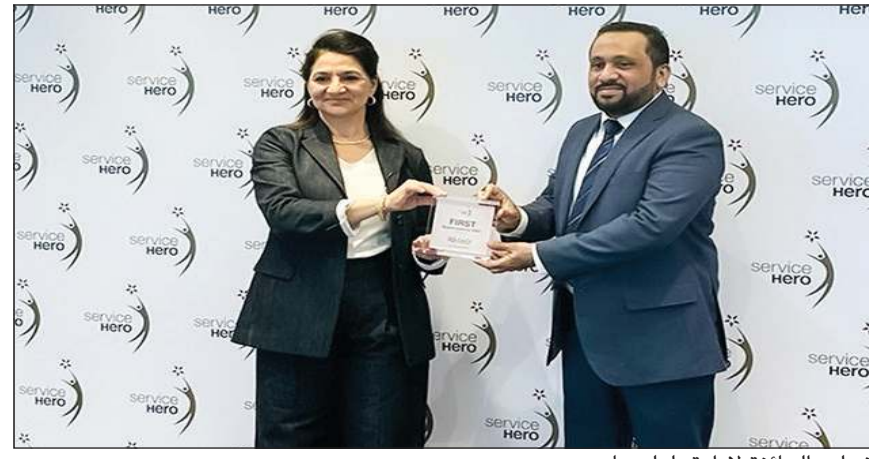
تسليم الجائزة لإدارة «لولو هايبر»

بحصد سوق «لولو هايبر ماركت» الجائزة الرائدة، مرة أخرى جائزة «سيرفس هيرو لعام 2023 خدمة العملاء» كأفضل سوبر ماركت لعام 2023 للعام الثالث على التوالي الذي يتم فيه تكريم هذه العلامة التجارية بناءً على خدماتها الاستثنائية للعملاء، ما يؤكد التزامها بتجاوز توقعات العملاء. ويسوق لولو هايبر ماركت من قبل برنامج جوائز مؤشر رضا العملاء «سيرفس هيرو»، وتم تكريم هايبر ماركت سابقاً على خدمته المتميزة، حيث تلقى جائزة «تقييم سيرفس هيرو» في 2013 و2014 و2021، وفي 2022 تم التعرف عليهم كأفضل متجر متخصمي.