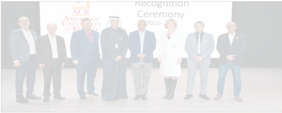
صورة جماعية لأعضاء هيئة التدريس الفائزين مع أ.د.روضة عواد وعمداء الكليات

أقامت الجامعة الأمريكية في الكويت حفلها السنوي لتكريم عدد من أعضاء هيئة التدريس، تقديراً لجهودهم البحثية المميزة التي بذلوها للارتقاء بالبحث العلمي في مختلف التخصصات. وأكدت رئيسة الجامعة الأمريكية في الكويت أ.د.روضة عواد، أن مساهمات أعضاء هيئة التدريس تروي مكانة الجامعة، قائلة: إن دوركم في هذه الرحلة لا يقدر بثمن، وقد استطعتم الهام ليس فقط الطلبة بل كل شخص منا للتفكير بشكل أعمق والقيام بعمل أفضل، كما أن العمل الجاد لأعضاء هيئة التدريس هو الذي جعل الجامعة مكاناً يتجاوز فيه التعليم الفصول الدراسية، إذ يقدم الأكاديميون أدوات لتغيير العالم. واستعرض مدير مركز الأبحاث والمنح العلمية د.إياد أبو دوش، إحصائيات متعددة لتوضيح المخرجات البحثية المتميزة لأعضاء هيئة التدريس، إذ تم إدراج العديد من الأبحاث في قاعدة البيانات العالمية SCOPUS والتي تضم عدداً كبيراً من الأبحاث المرموقة التي نشرت