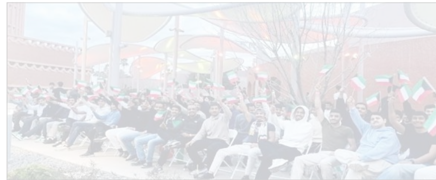
جانب من الطلبة خلال الاحتفال بالأعياد الوطنية

المذكور لـ «الأبناء»: النادي يسعى للتمثيل الطلابي الدارسين في أميركا وإشراكهم بمختلف المناسبات