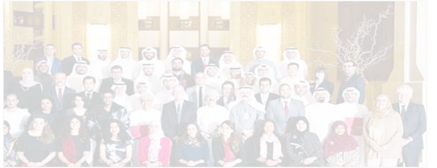
مجموعة من موظفي «بيتك» المشاركين في البرنامج

شارك بيت التمويل الكويتي «بيتك»، في برنامج كلية هارفارد لإدارة الأعمال لتطوير القيادات في البنوك، الذي أقيم مؤخرًا في سلطنة عمان على مدى 6 أيام متتالية تحت عنوان «القيادة وتنفيذ الاستراتيجيات في مجال الخدمات المالية، ويتكون من محورين هما «الإدارة الاستراتيجية» و«القيادة»، حيث يستهدف البرنامج مديري الإدارات التنفيذية وروساء الأقسام في البنوك والمؤسسات المالية.