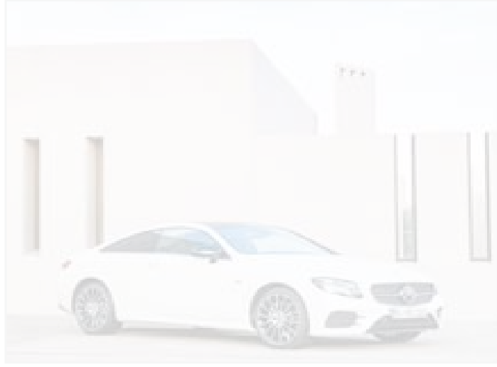
ميرسيدس E كوبيه الجديدة