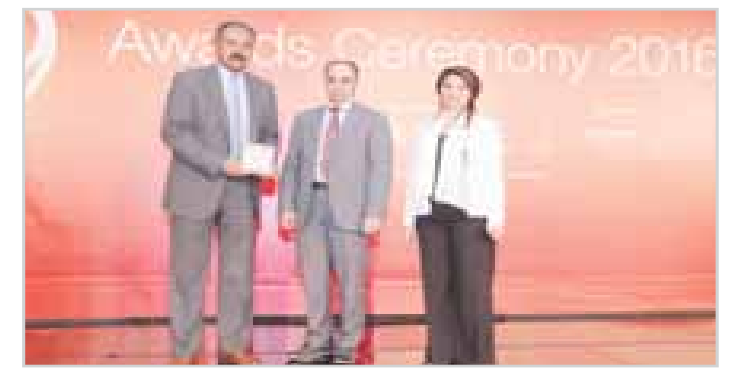
أثناء تسلم الجائزة

وجددت رويال حياة التزامها باستمرار تقديم أفضل ما في القطاع الصحي من خدمات وتقنيات واستقطاب أفضل الامكانيات البشرية بهدف الارتقاء في القطاع و ضمان سلامة المرضى وترسيخ المفاهيم والروية التي انطلقت منها رويال حياة منذ عام 2006 حتى الآن.