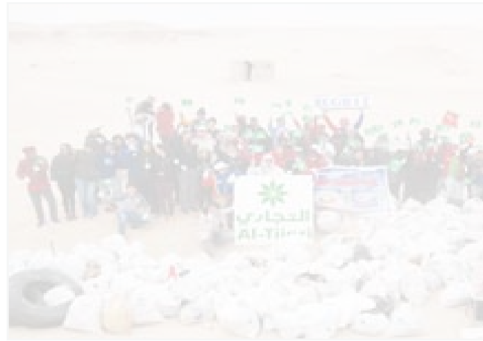
جانب من الحملة

قدم البنك التجاري رعايته لحملة «فلنجعل من الصحراء واحة»، تحت شعار «فلنكن أبطالاً»، والتي تهدف إلى التوعية بأهمية الحفاظ على نظافة البيئة البرية وزرعها بالنباتات وجعلها خضراء، وذلك بالتعاون مع الجمعية الكويتية لحماية الحيوان وبيئته، وتأتي هذه الخطوة استكمالاً لحملة السابقة الخاصة بتنظيف الشواطئ التي تم إطلاقها مؤخراً ضمن برامج حماية البيئة البحرية والبرية.