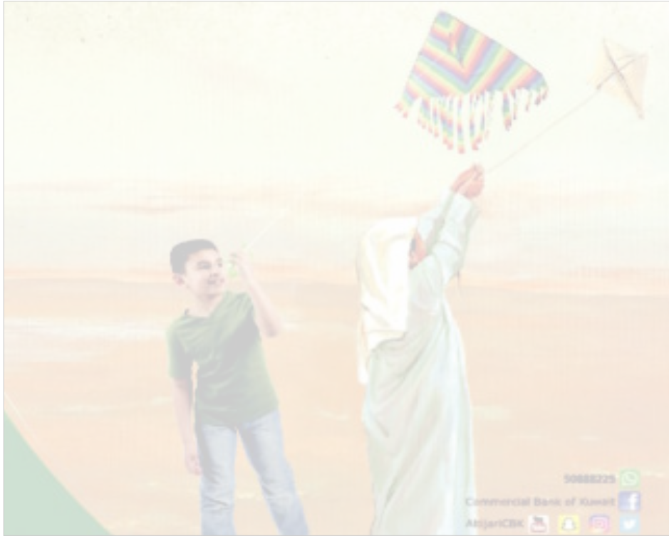
إحياء متواصل للتراث القديم

يفتح البنك التجاري اليوم جناحه في «غرانند أفنيو»، ضمن فعاليات حملة «يا زين تراثنا» السادسة، لمدة يومين متتاليين، بهدف تعريف رواد وزائري المجمع على بعض جوانب التراث الكويتي القديم.