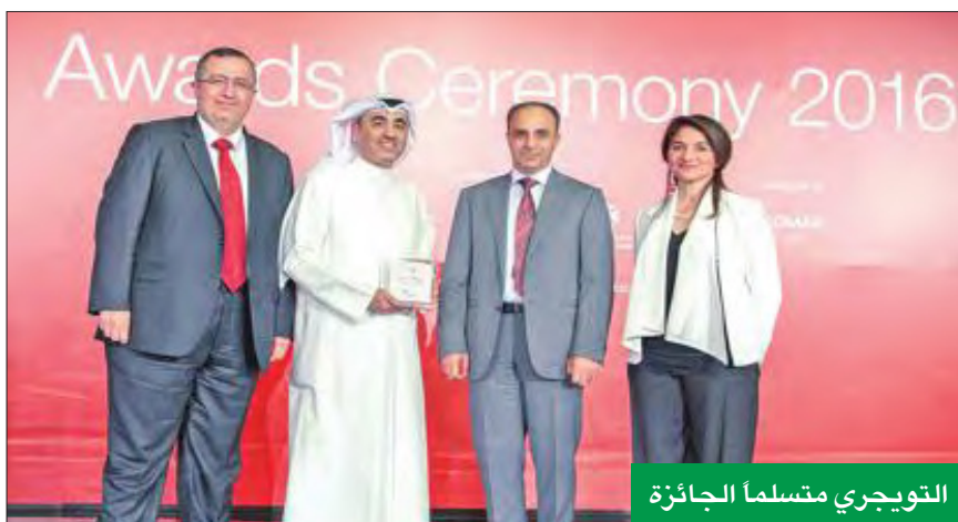
التوقيع متسلماً الجائزة

كالكويت تفرض تحديات على البنك يعمل على تجاوزها برفع وتطوير مستويات خدمة العملاء لديه.